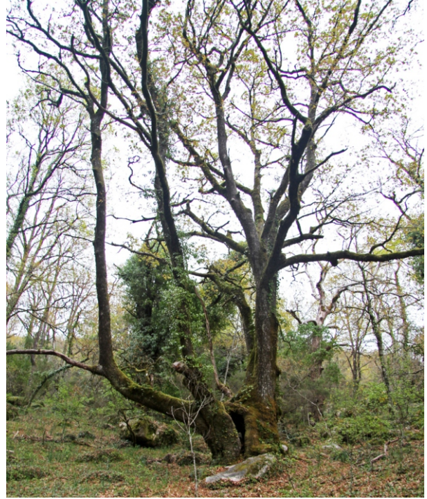
Carballo no comezo da ruta, á beira da estrada.

A volta faise máis lixeira que a subida pero a baixada tamén ten o seu aquel.