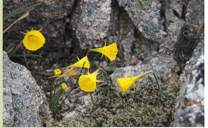
Narcisos nun furado entre as rochas