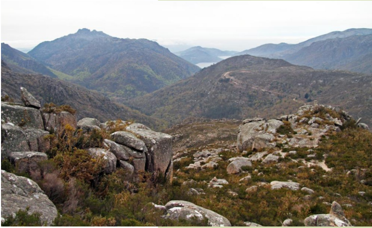
Vista da mata da Albergaria